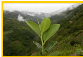
Hoja de coca